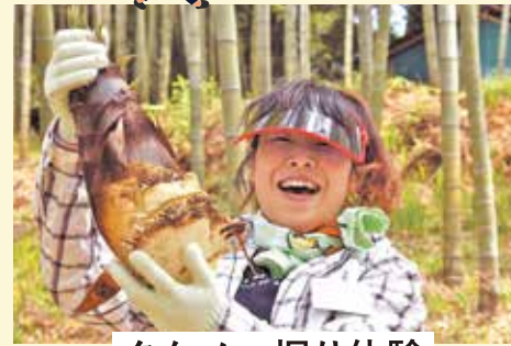
タケノコ掘り体験

掘り立て、ゆでたてのタケノコの香りと柔らかさ。ご自分で収穫したのなら味も格別です。この道40年のインストラクターがご案内します。生の刺身も味わえるかも？ 日程、人数限定です。ご予約ください。