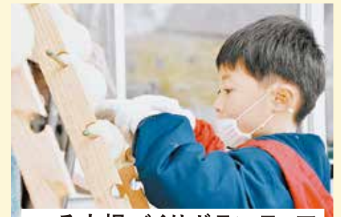
へそ大根づくりボランティア

冬の寒さと天日で大根の旨みを凝縮する伝統の保存食。地域の方々と一緒にへそ大根づくりのお手伝いができます。へそ大根作りを通して、筆甫地区の豊かな自然と伝統の食文化に触れてみてください!