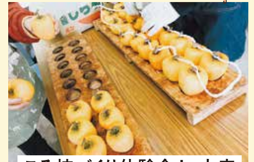
ころ柿づくり体験会 in 丸森

ころ柿のカーテンは丸森町の初冬の風物詩です。農家直伝のころ柿(干し柿)づくりの体験会です。集中して皮をむくのが楽しい、とりピーター続出。2ヶ月後の1月には綺麗でフワフワのころ柿がご自宅へ届きます。