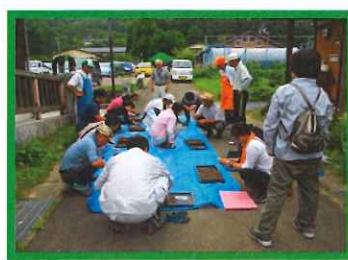
④7/13 ブロッコリー播種