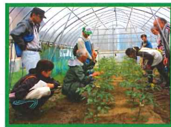
③6/8 ミニトマト脇芽取り