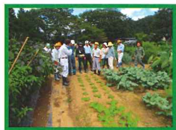
⑧9/14 実習畑の巡回指導