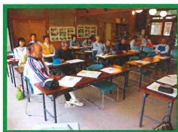
⑨10/5 越冬野菜と土づくり講座