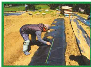
②5/18 なす、ピーマン定植