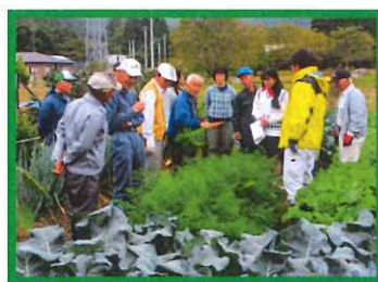
⑩10/5 実習畑の巡回指導